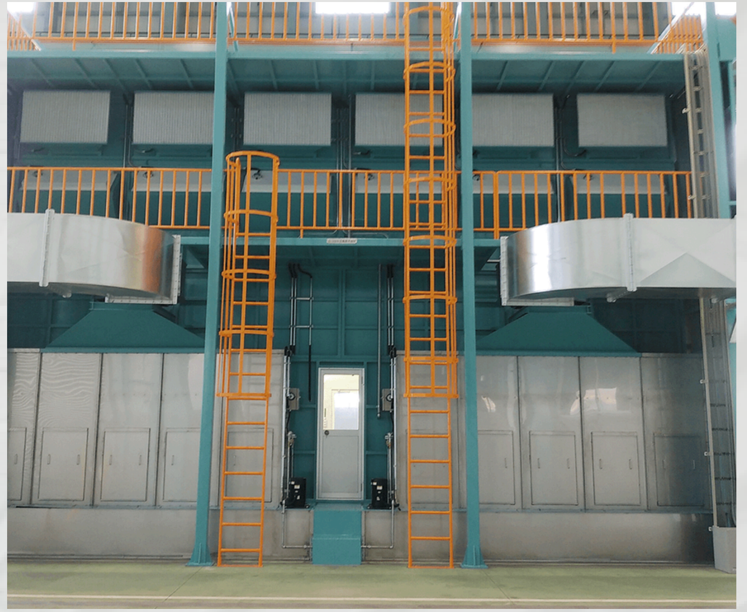
——特注湿式塗装ブース参考写真——