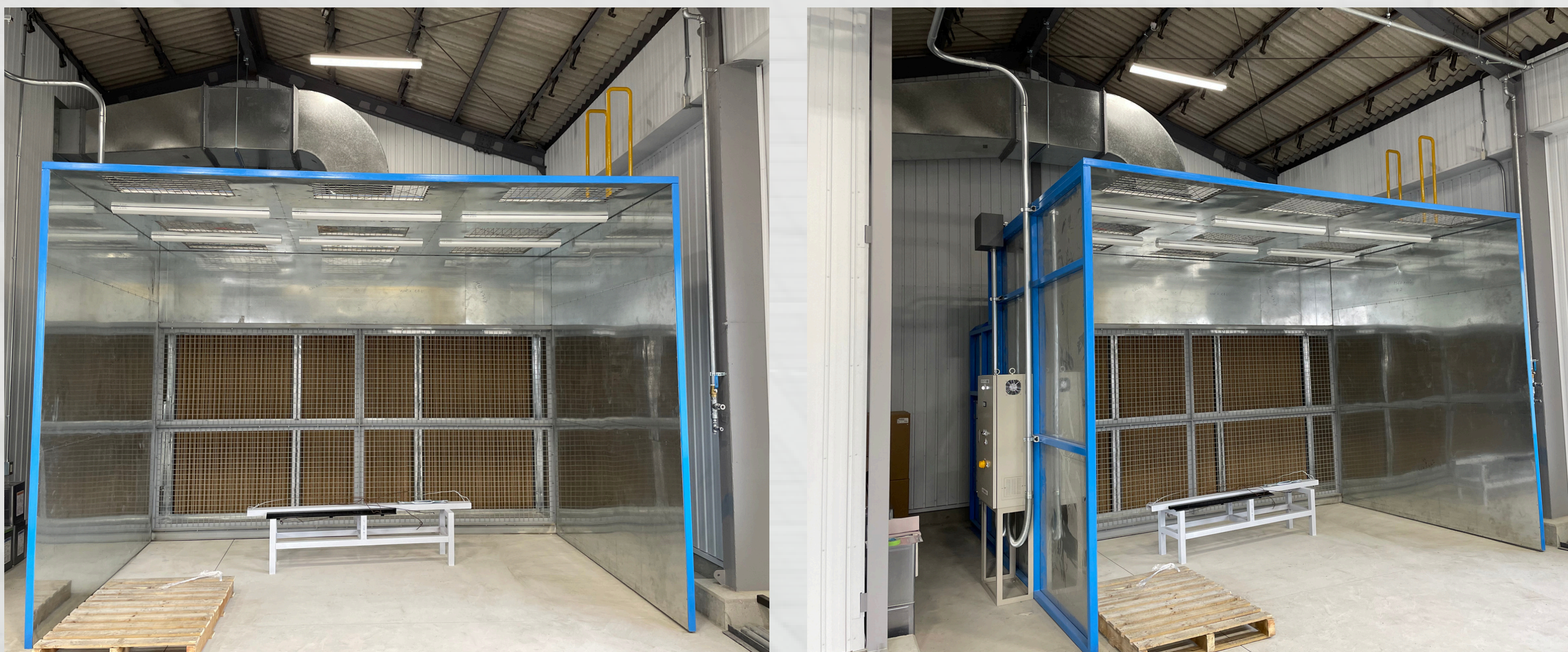
——特注乾式ブース参考写真——