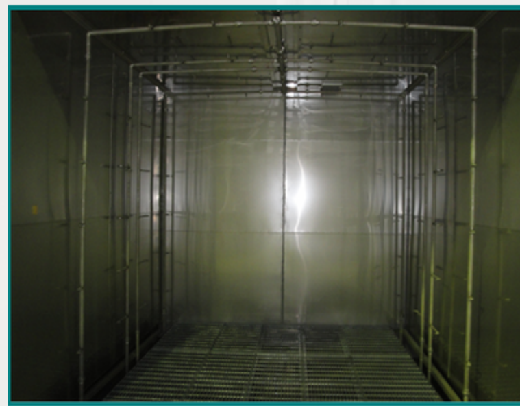
シャワーは上下左右4方向から往復処理 →ライザーは前後に自動で動き ムラなく処理が可能です。