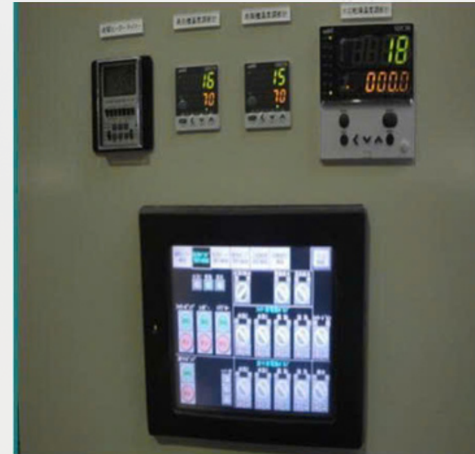
見やすく操作しやすいタッチパネル →処理状態や工程時間が 一目で確認できます