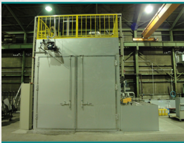
設置方法は、FL設置型とピット型の2種類(写真はピット型の設置例)