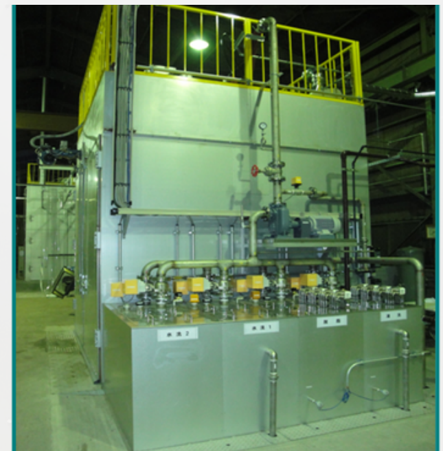
処理液タンクはサイド設置 →薬品の調整が容易です