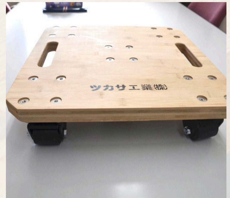
※上記写真は、1,000KGタイプの参考写真となっております。