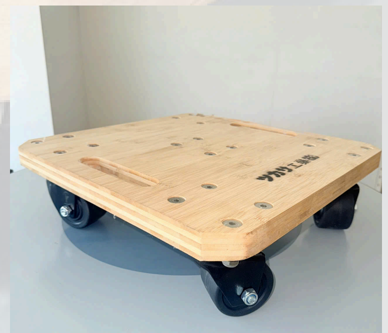
※上記写真は、2,000KGタイプの参考写真となっております。